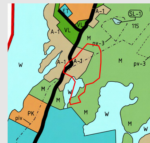
Kyrklätts generalplan 2020