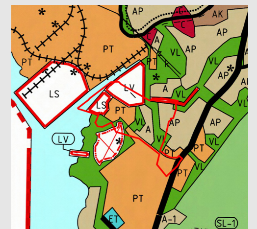
Kyrklätts generalplan 2020