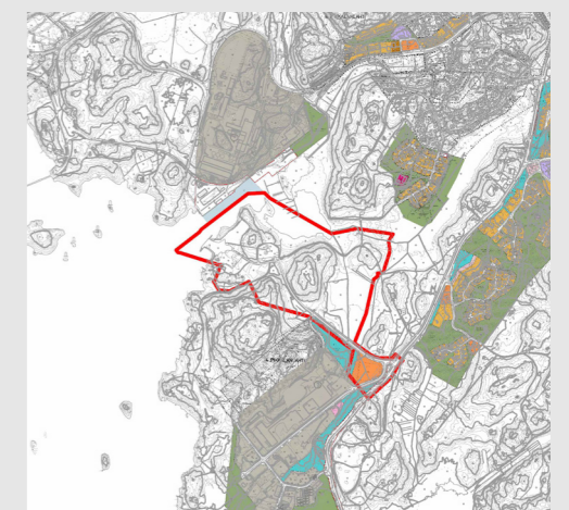
Planläggningssituationen i närområdet