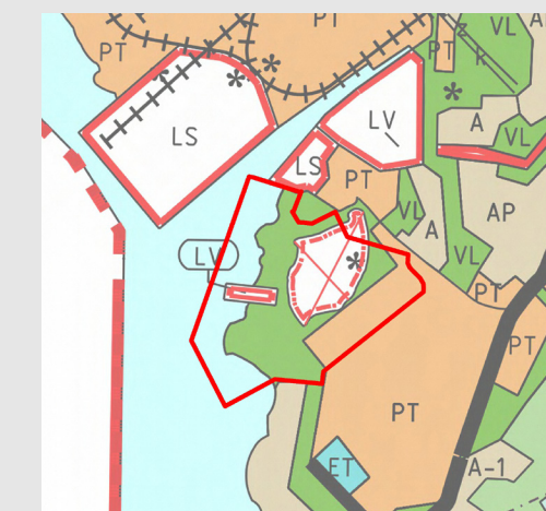
Kyrklätts generalplan 2020