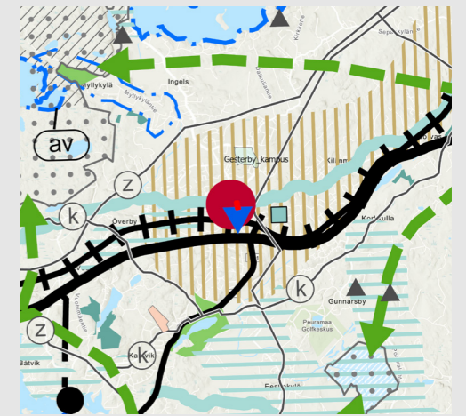
Situation för landskapsplanen