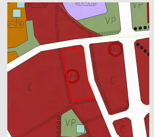
Kommuncentrum delgeneralplan, etapp 1.