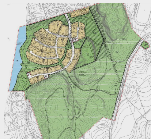
Utdrag ur utkastet till detaljplan för Veikkolabäcken