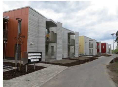
Flervåninghus i Herrgårdsstranden, Bostadsgård på bostadsområde i Smedsede, Närbutiken i Tolls, Flervåninghus på Rågövägen