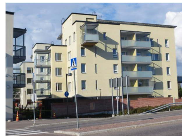
Utvidgningen av Kyrkslätt's huvudbibliotek, plan (JKMM-Arkki-tehdit Oy), Flervåningshus i Kyrkslätt's affärscentrum