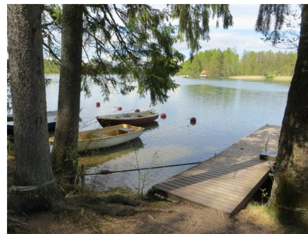
Bastubyggnad i Hila, Sjölandskap i Kyrkslätt