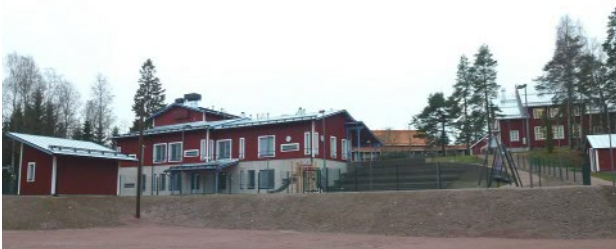
Sarfviks gårds före detta ladugård, Obbnäs garnison, Utvidgningen av Sjöökulla inlärningscenter