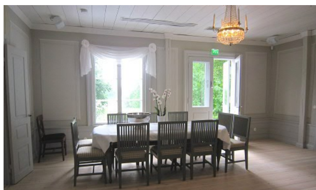
Landskapet vid Sjökulla gård, Landskap i Haapajärvi, Salen i Vols gård