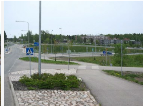
Bredbergets bostadsområde, Tolls station, Vuorenmäen koulu, Veikkola, Jorvas planskilda anslutning och Ericssons arbetsplatsområde