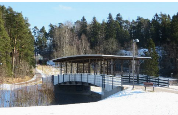
Banvallens bostadsområde i Masaby, Gångbron i Kyrkdalsparken (Doktorsstigen)