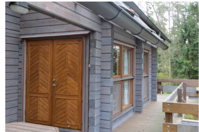
Bobäcks FBK-hus, Veikkola industriområde, Fritidsbyggnad på Mössö