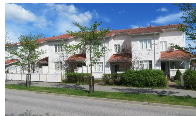
Utsikt mot kommuncentrum från Prästgårdsbackens berg, Bänk som gjorts som elevarbete, utställning i kommunhuset maj 2014, Bostadshus i Herrgårdsstranden